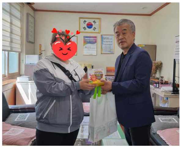
( 영양제 전달 )