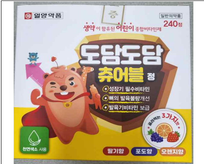
( 영양제 제품 )