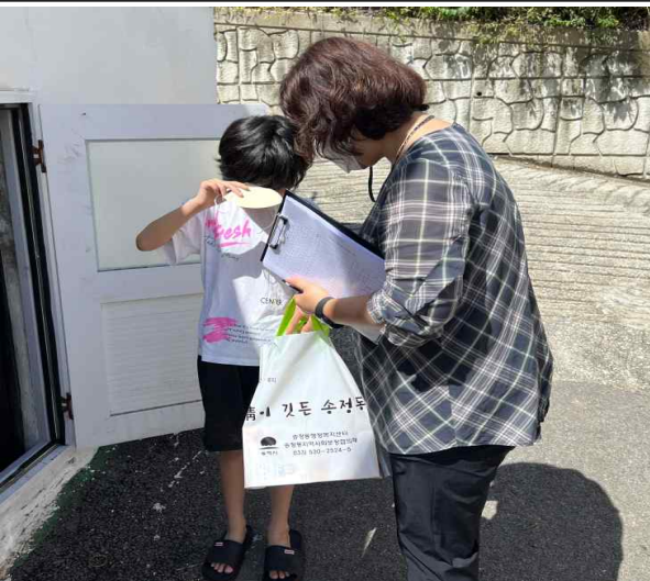
( 영양제 전달 )