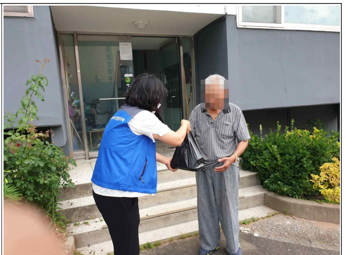
( 전달사진 )