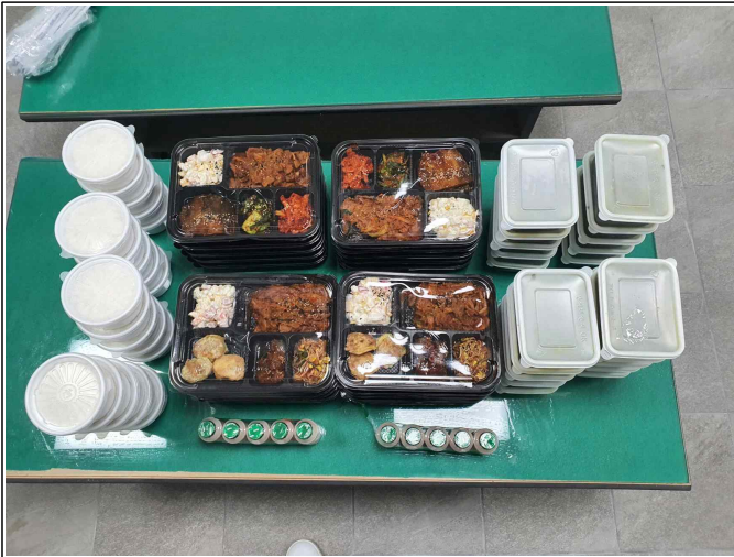
( 도시락 사진 )