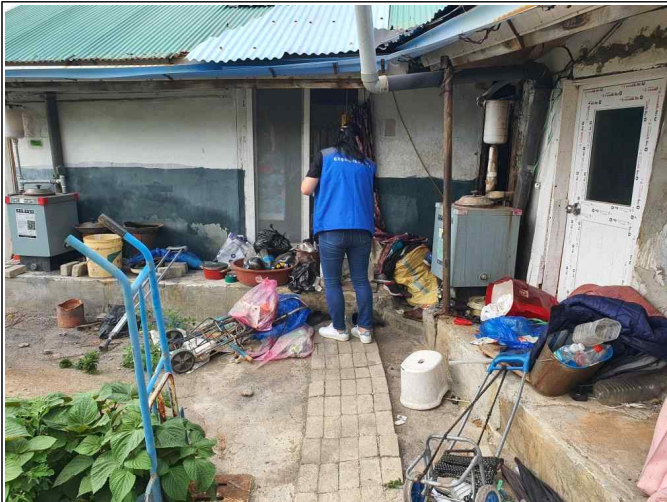
( 전달사진 )