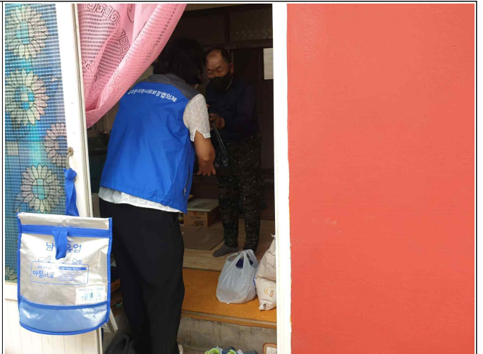
( 전달사진 )