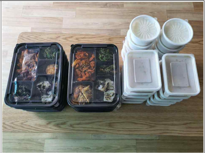
( 도시락 사진 )