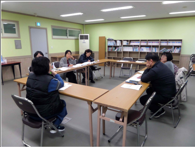
( 복지기획사업 7차 최종회의 )