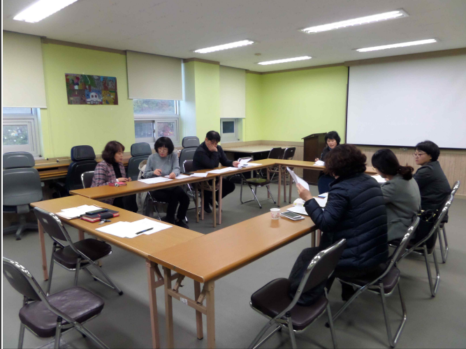
( 복지기획사업 7차 최종회의 )