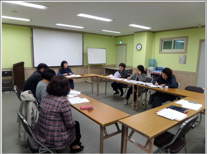
( 복지기획사업 7차 최종회의 )