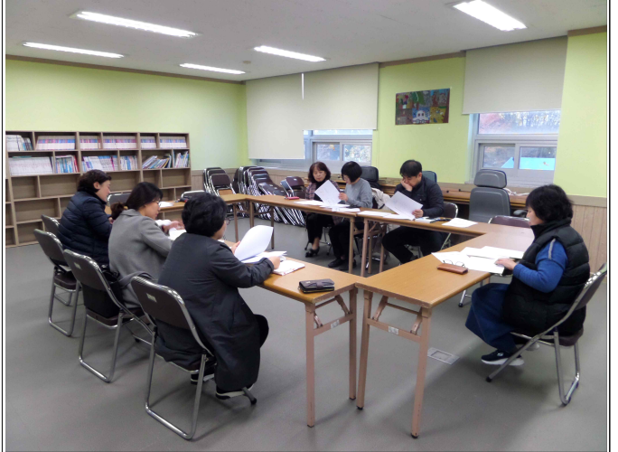
( 복지기획사업 7차 최종회의 )