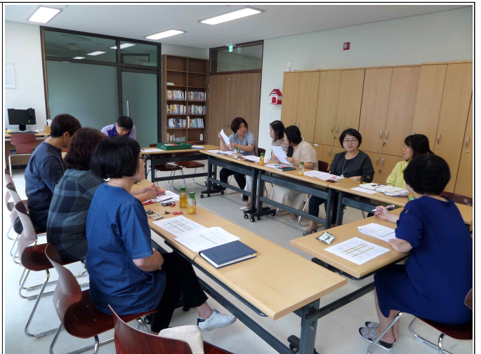
( 복지기획사업 4차 회의 )