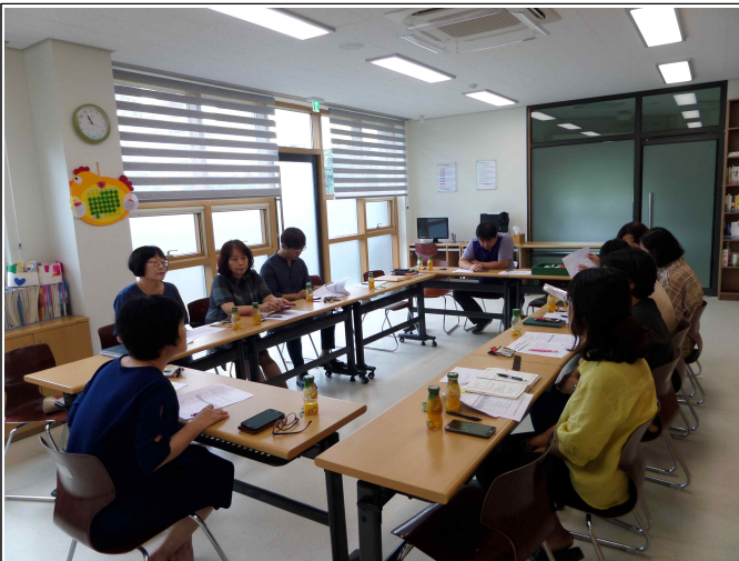
( 복지기획사업 4차 회의 )