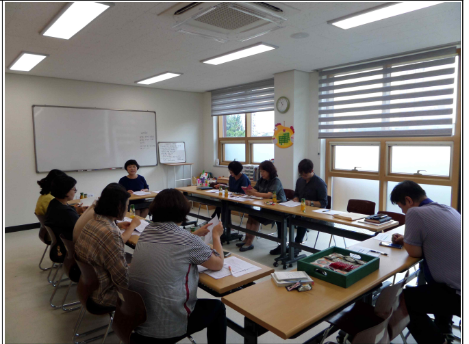
( 복지기획사업 4차 회의 )