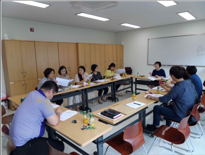
( 복지기획사업 4차 회의 )