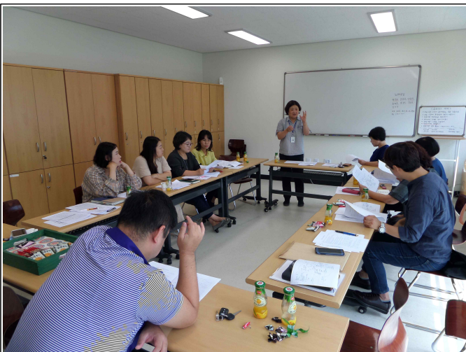
( 복지기획사업 4차 회의 )