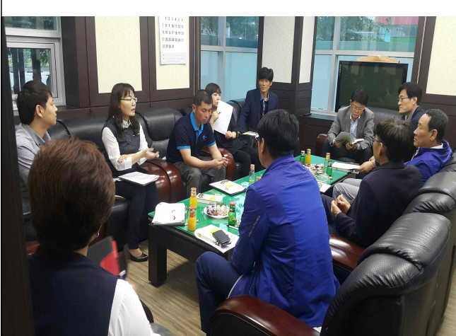
협업체 회의를 통한 사업 논의