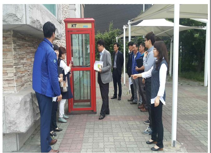
행복나눔부스 현장 계획