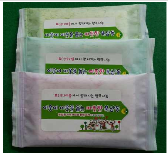
홍보 물티슈 제작(자부담)