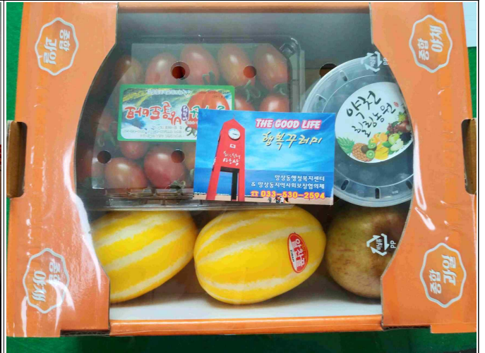
(7월 과일 꾸러미 사진)