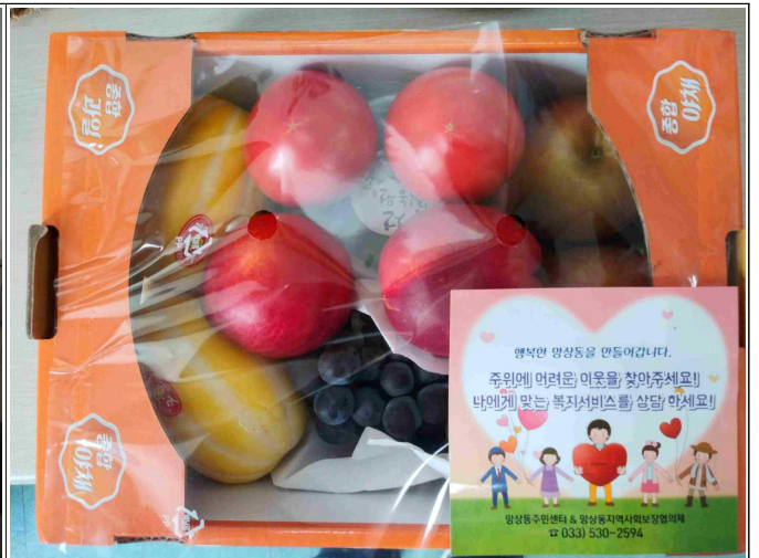
(8월 과일 꾸러미 사진)