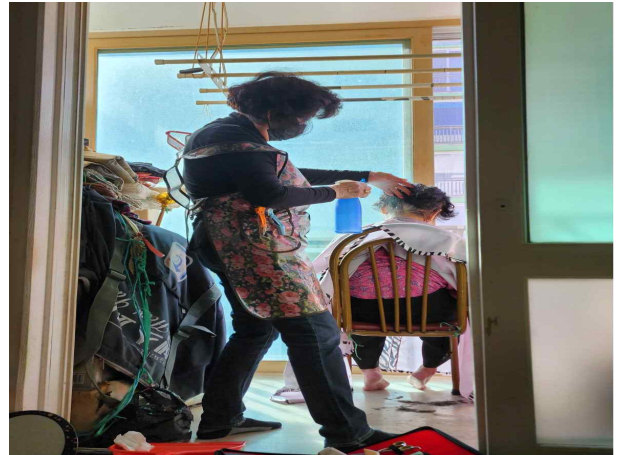
찾아가는 이·미용 서비스