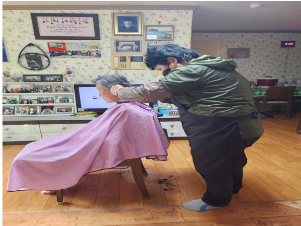
찾아가는 이·미용 서비스