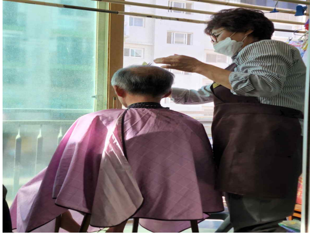
찾아가는 이·미용 서비스