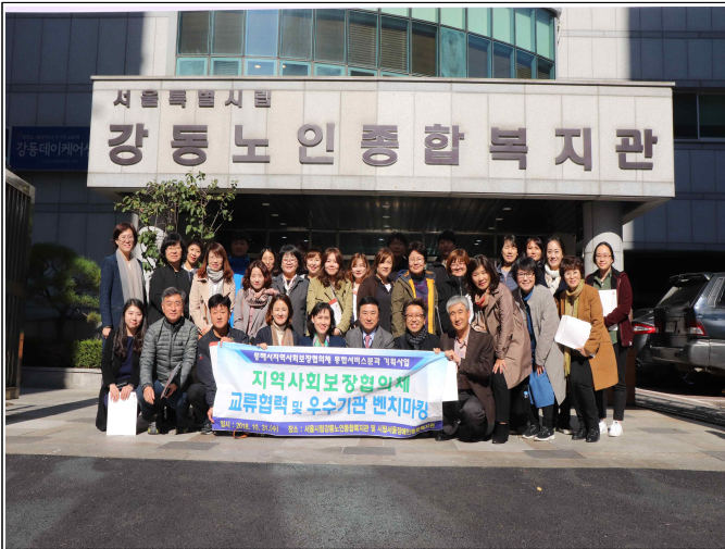
우수기관 벤치마킹 (서울시립강동노인종합복지관)