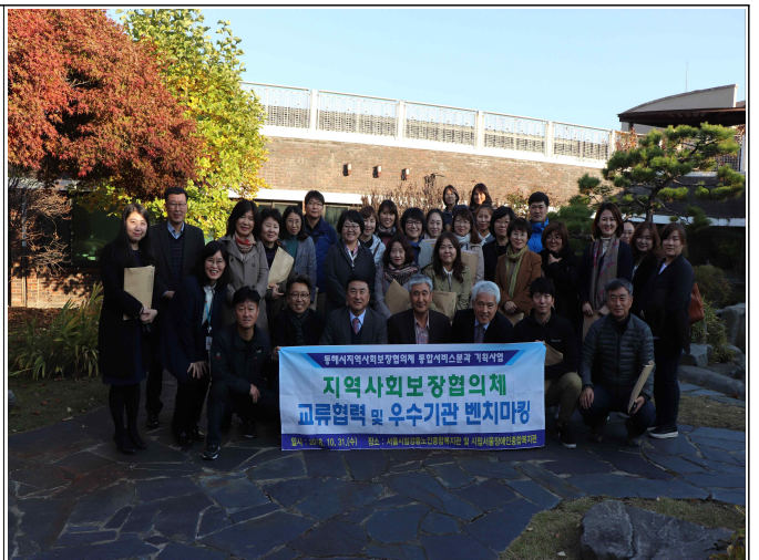
우수기관 벤치마킹 (시립서울장애인종합복지관)