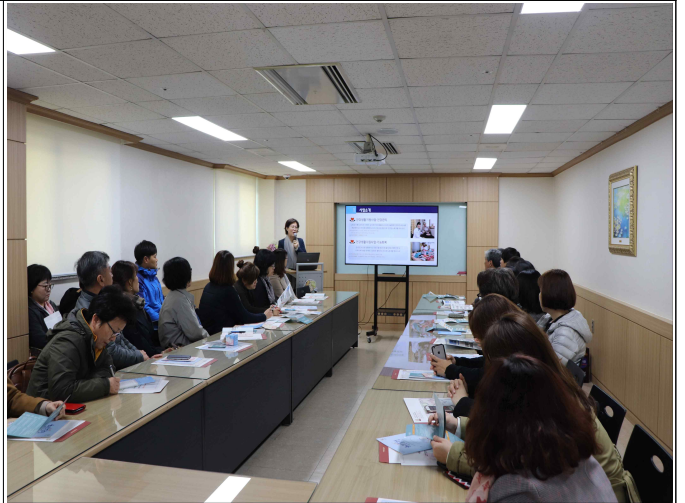
우수기관 벤치마킹 (서울시립강동노인종합복지관)