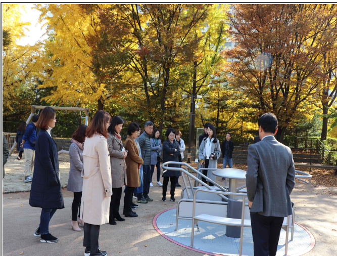
우수기관 벤치마킹 (시립서울장애인종합복지관)