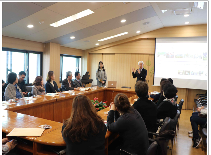
우수기관 벤치마킹 (시립서울장애인종합복지관)