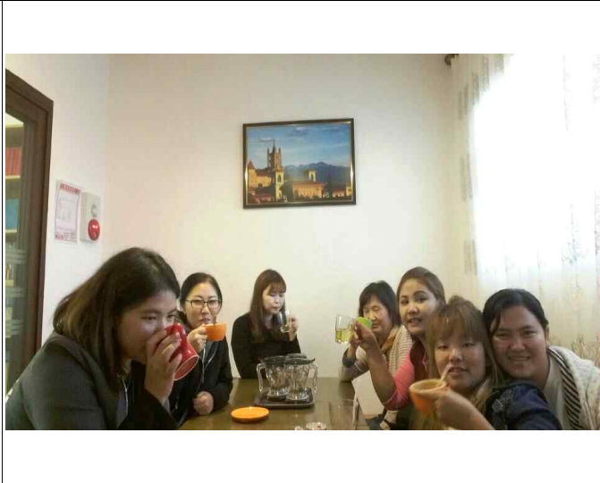
( 동그라미 인형극단 )