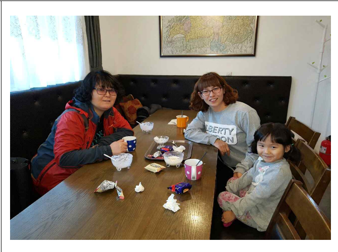
( 힐링토크 )