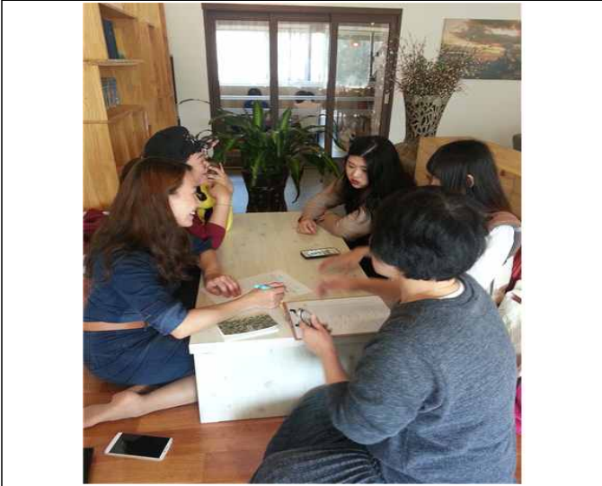
( 이소룡 모임 )